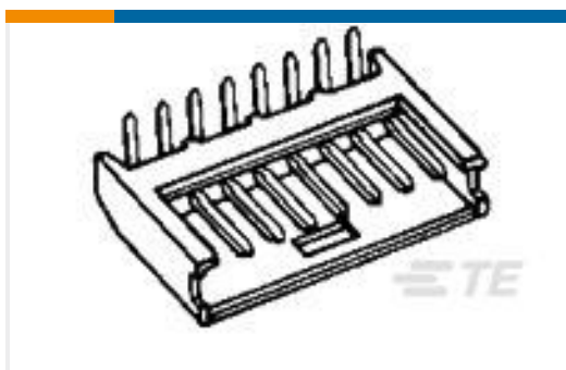
TE 产品编号280378-1 4P AMPMODU II SHRD HDR, RT ANG, TIN