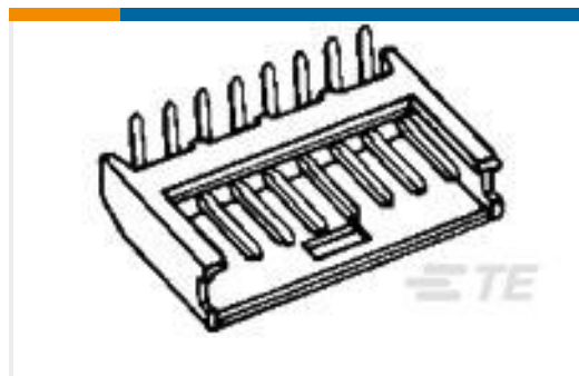
TE 产品编号280379-1 6P AMPMODU II SHRD HDR, RT ANG, TIN