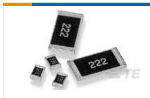
TE 产品编号1623461-1 CRG1206 1% 22K