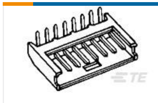
TE 产品编号280380-1 8P AMPMODU II SHRD HDR, RT ANG, TIN