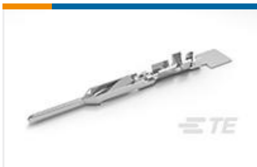
TE 产品编号1-86557-9 FFC,PIN CONTACT,ROUND WIRE,22-