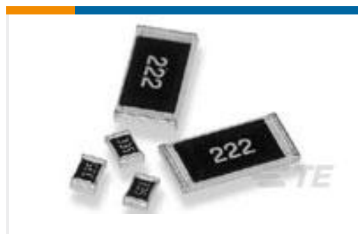
TE 产品编号1623517-1 CRG1206 1% 470R