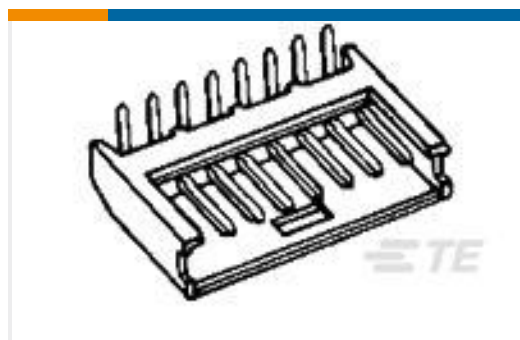
TE 产品编号280381-1 10P MODU II SHRD HDR, RT ANG, TIN