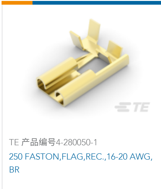
TE 产品编号4-280050-1 250 FASTON,FLAG,REC.,16-20 AWG, BR