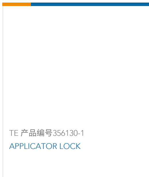
TE 产品编号356130-1 APPLICATOR LOCK