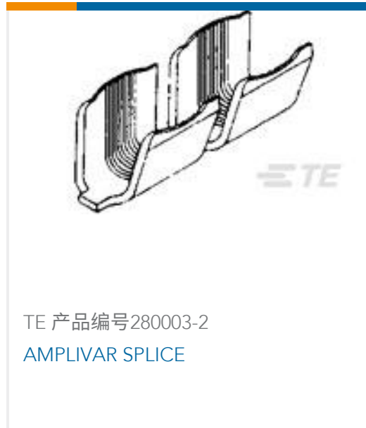
TE 产品编号280003-2 AMPLIVAR SPLICE