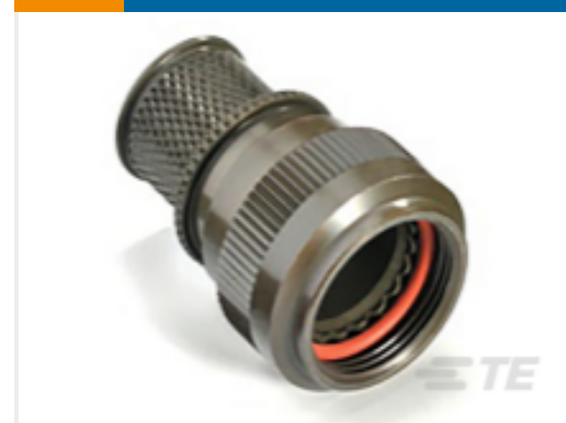
TE 产品编号 BTH1-09-03-1-B BTH1-09-03-1-B