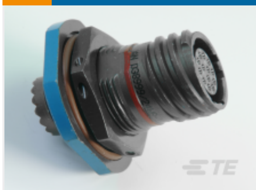
TE 产品编号 YDTS24F23-53PNV001 RECP ASSY