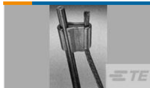
TE 产品编号5-276337-9 AMPACT CU TAP 300-2/0