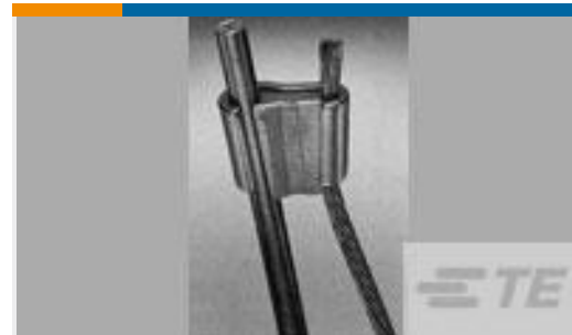
TE 产品编号5-276337-1 AMPACT CU TAP 350-2