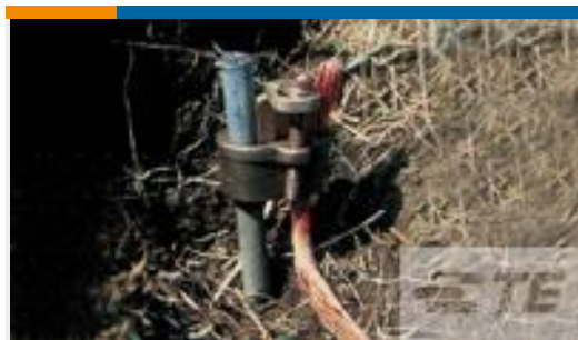
TE 产品编号80408-6 SHEAR-LOK 3/4" CU CLAD-1/0