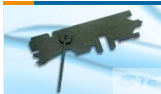
TE 产品编号314199-1 AMPACT CLEANING TOOL