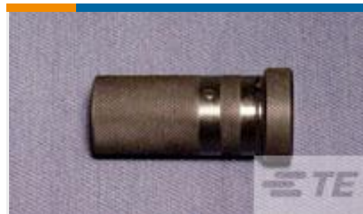
TE 产品编号314196-1 BRECH NUT ASSEMBLY