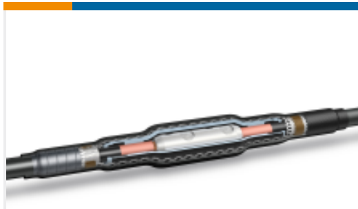
TE 产品编号EA3547-000 Inline Splice: Cold Shrink, 15-35 kV