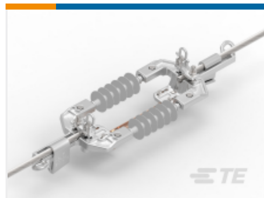
TE 产品编号1710731-4 35kILD-KS9C-T336.4-397.5