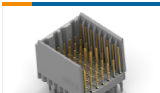
TE 产品编号2336514-1 2MM HM MALE CONNECTOR, COL 8, M2