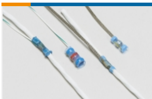
焊接套管屏蔽终结器(25)