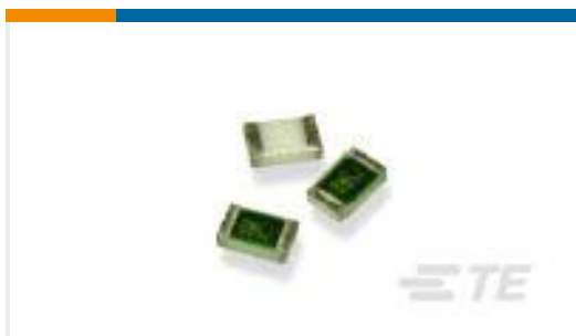
TE 产品编号2-1879208-6 CPF 0402 110R 0.1% 25PPM 1K RL