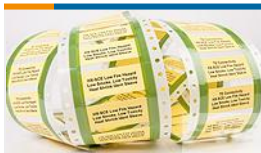
TE 产品编号F16068-000 HX-SCE-5K-3.2-50-S1-4