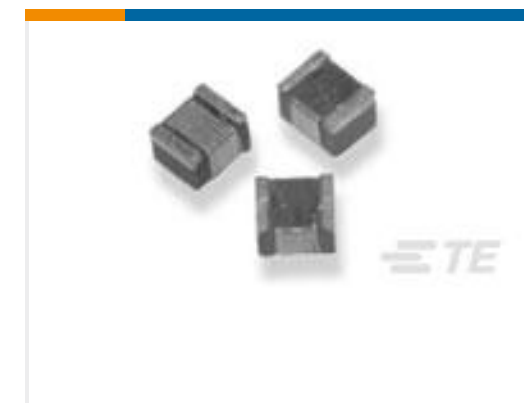
TE 产品编号8-1624112-2 3650 0603 43nH 5% 2K RL