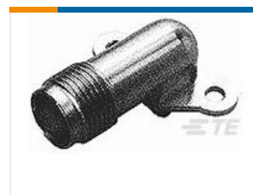
TE 产品编号413933-1 JACK, RTANG, PCB, 50 OHM, TNC