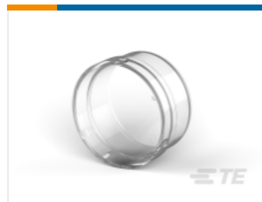
TE 产品编号1-2306128-1 COVER, LIGHT CONTROLLER, 76MM DIA,SHORT