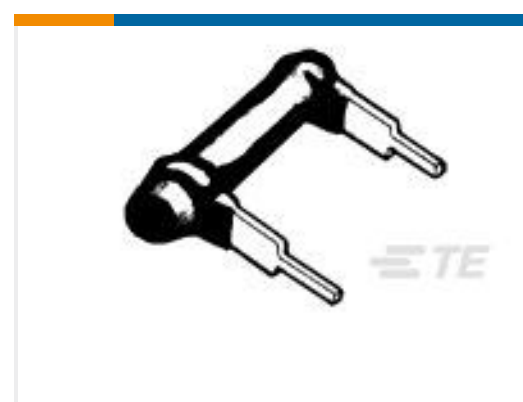
TE 产品编号1623713-7 FCB2 1R0 5% HP