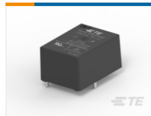
TE 产品编号1558662-1 T9GV2L14-5