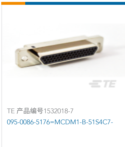
TE 产品编号1532018-7 095-0086-5176=MCDM1-B-51S4C7-