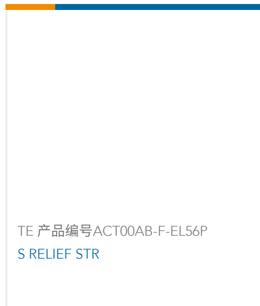
TE 产品编号ACT00AB-F-EL56P S RELIEF STR