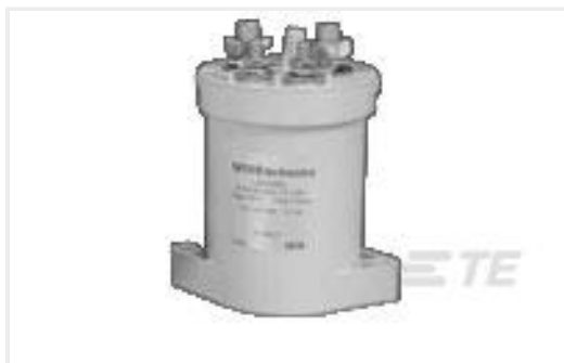
TE 产品编号9-1618389-8 LEV100A5ANG=RELAY, SPST, 24Vdc