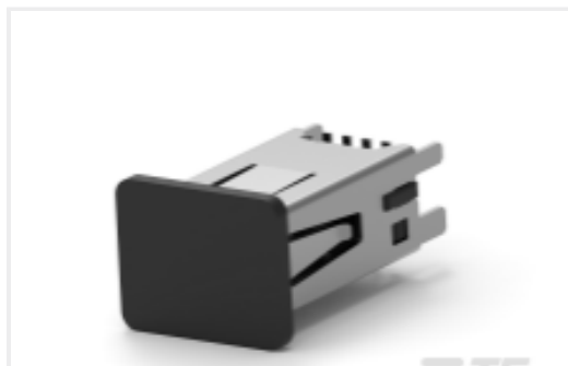
TE 产品编号2-2271656-1 TYPE I SMT REC. WITH CAP ON EMBOSS TAPE