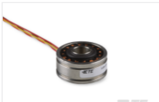
TE 产品编号2-1393047-5 RESOLVER V23401-S1001-B101