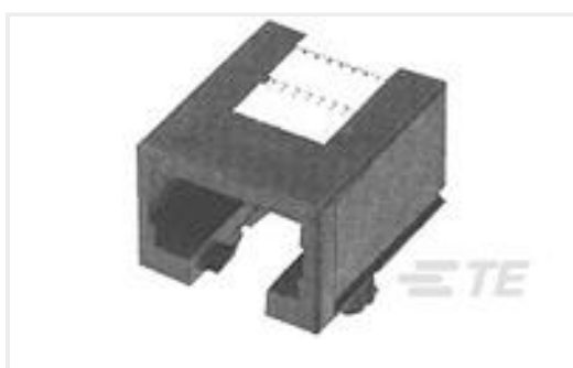
TE 产品编号2-215875-1 4/4 PCB MOD.JACK SE