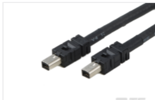
TE 产品编号2325716-1 CA MINI IO MINI IO TYPE I