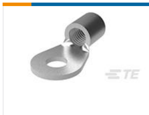
TE 产品编号1958439-1 STRA,RT,4 AWG,M3.5/#6,HR,AU