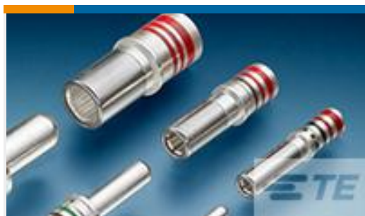
TE 产品编号 0662-207-0882 CONT SOC ASSY