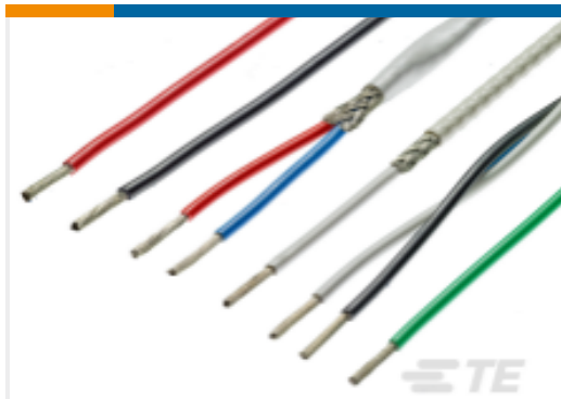
TE 产品编号262172-001 81044/6-14-2