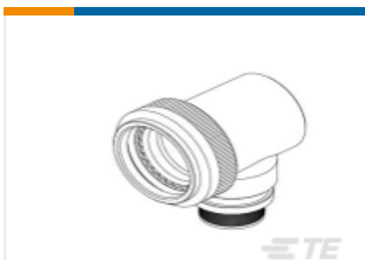
TE 产品编号CW0595-000 TX18AZ90-1606