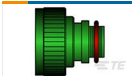
TE 产品编号067443-000 TXR15AB00-2416AI