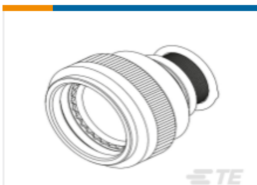
TE 产品编号CW0598-000 TX40AZ00-2010