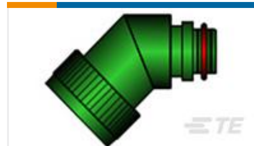
TE 产品编号EG1602-000 TX15AZ45-0804