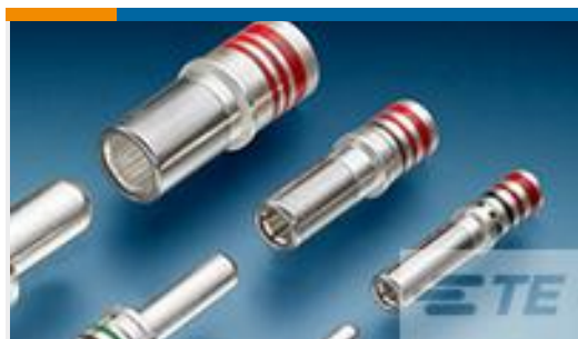
TE 产品编号 0662-207-0882 CONT SOC ASSY