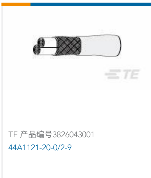
TE 产品编号3826043001 44A1121-20-0/2-9