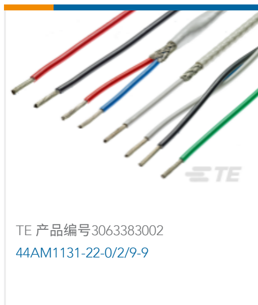
TE 产品编号3063383002 44AM1131-22-0/2/9-9