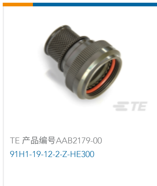
TE 产品编号AAB2179-00 91H1-19-12-2-Z-HE300