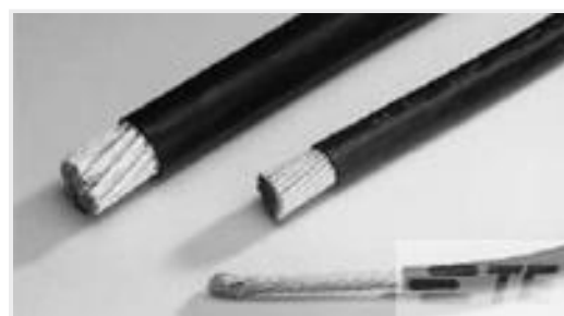
TE 产品编号6087313001 FTR16-95-0