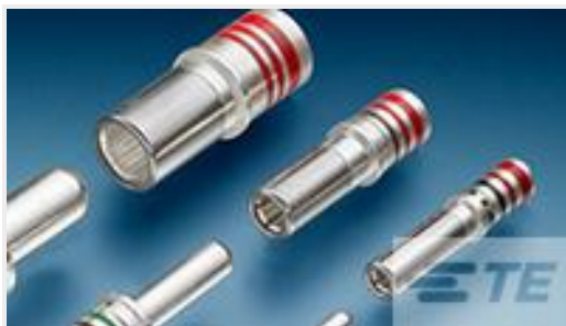
TE 产品编号 0662-207-0882 CONT SOC ASSY