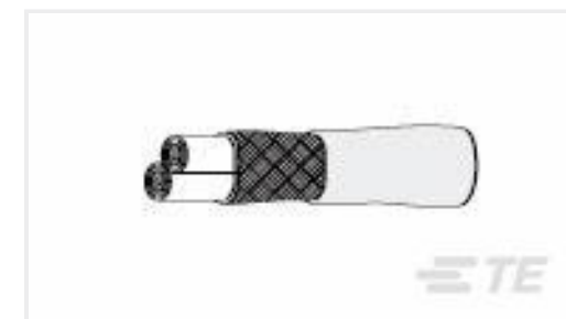
TE 产品编号3822293013 44A1121-20-0/9-9