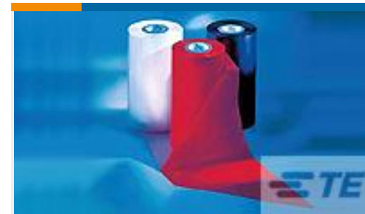
TE 产品编号557721-000 TMS-RJS-RIBBON-4RPSCE