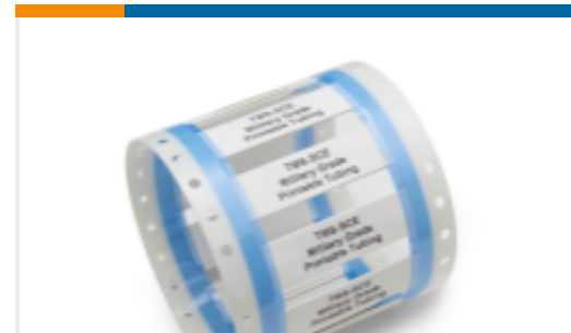
TE 产品编号9422810001 TMS-SCE Military Grade Sleeves