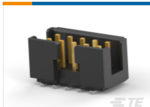
TE 产品编号1-2373376-0 10P,2MM,SHRD HDR,DRVVT,SMD,0.1 AU,TB