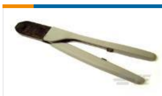
TE 产品编号91558-1 CCII D-3 L REC TAB 20-16 ASSY