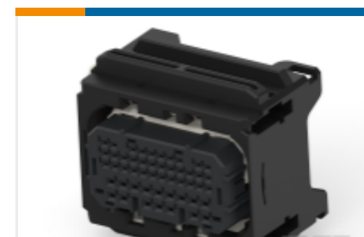
TE 产品编号2174106-1 PLUG HOUSING ASSEMBLY 50POS 0.5 /1.0