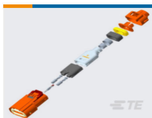
TE 产品编号YHV280-2PM-P-4MM-B HVA280-2phm,pass,4sqmm,Key B