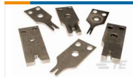
TE 产品编号1-1633961-2 CRIMPER, INSULATION F PREMIUM 25SQMM