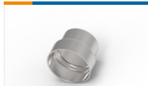
TE 产品编号2177090-3 STEEL,OUTER FERRULE,8MM HV, 25SQMM