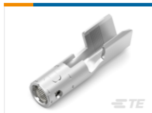
TE 产品编号2208669-3 8MM HV, CONTACT,ASSY