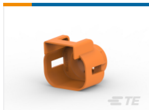
TE 产品编号2103013-3 CABLE SEAL RETAINER, SIZE 2, OR, HVA280