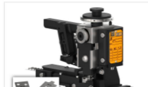
TE 产品编号7-2266101-1 OCEAN_2.0_APPLICATOR-S-090F1100