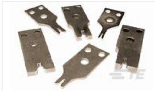
TE 产品编号1-1633305-8 CRIMPER, WIRE PREMIUM