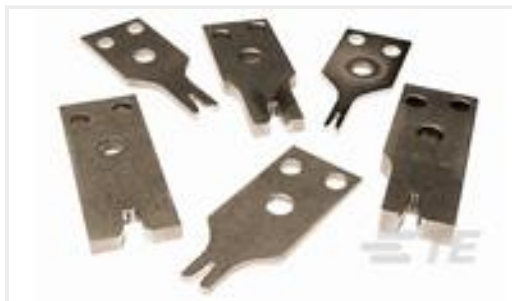
TE 产品编号3-1633961-9 CRIMPER, INSULATION F PREMIUM