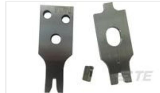
TE 产品编号7-2266126-7 OCEAN_2.0_SPARE_PART_KIT-117F1140