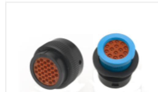
TE 产品编号2600006-1 SHELL 18-14CKT RCPT W/SCKT BLUE W/LIP