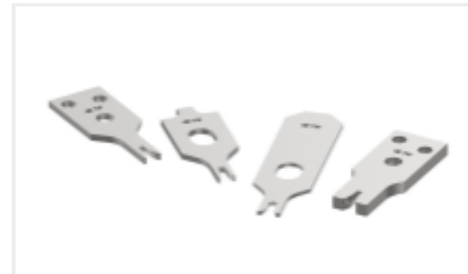
TE 产品编号2-1803019-8 CRIMPER, INSULATION O