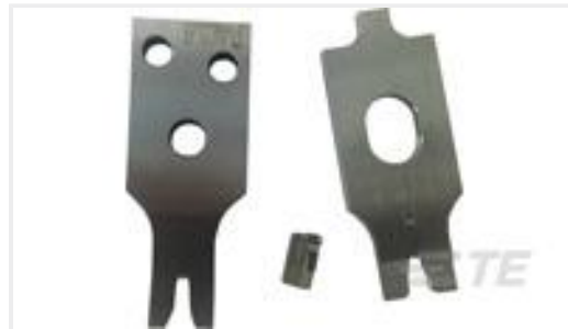
TE 产品编号7-2266102-7 OCEAN_2.0_SPARE_PART_KIT-090F0900