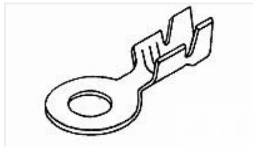
TE 产品编号640007-3 RING TERMINAL 16-14 AWG TPBR