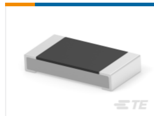
TE 产品编号4-2176392-5 RQ 1206 383K 0.1% 10PPM 5K RL