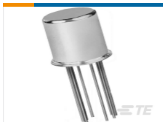
TE 产品编号1617127-8 JM5C-26XM = M39016/11-036M