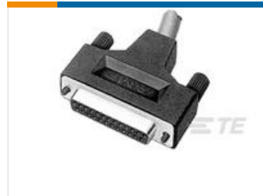
TE 产品编号1-747947-5 KIT, RCPT, 25P, HDE, SHLD ENCLSR