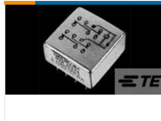
TE 产品编号2-1617516-8 3SBM1064A2=M39016/31-002L