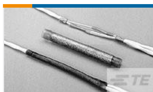
TE 产品编号CM0967-000 D-150-0348