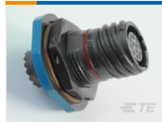
TE 产品编号YDTS24F21-35BNV001 RECP ASSY