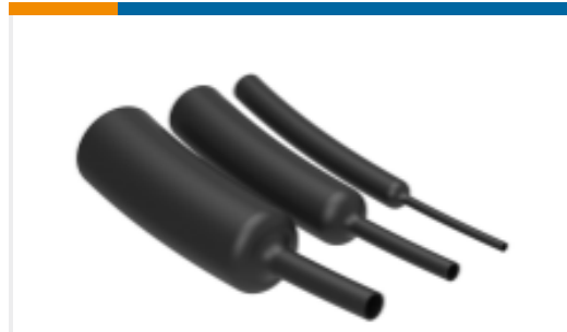
TE 产品编号7903004004 RNF-3000 Heat Shrink Tubing