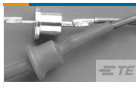
TE 产品编号F119874001 RNF-3000-4.5/1.5-5-SP