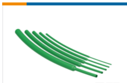
TE 产品编号NB20484001 VERSAFIT-3/32-5-SP