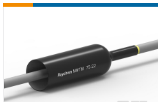
TE 产品编号518766-000 MWTM-75/22-1500/S(S5)