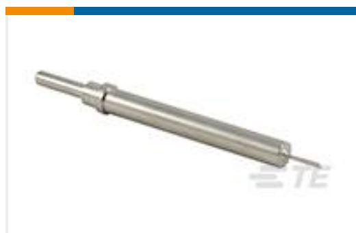
TE 产品编号0460-208-12141 PIN, SOLID, SIZE 12, EXTENDED PCB, NI