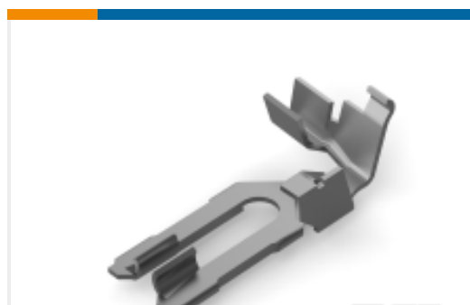
TE 产品编号926972-1 MT-EDGE CRIM CONTACT