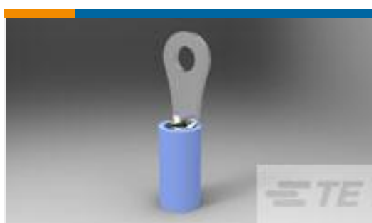
TE 产品编号324159 TERM, RING, PIDG, 16-14, #4