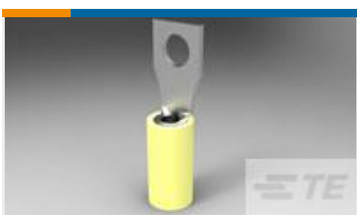
TE 产品编号2-327960-1 TERMINAL, PIDG RECT 12-10 6