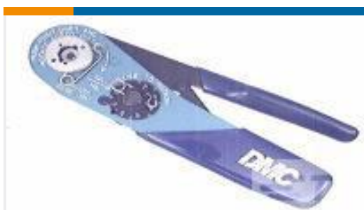
TE 产品编号 601966-1 CRIMPING TOOL M22520/2-01