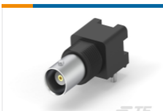
TE 产品编号5413631-1 BNC RF Connector: Male (Jack), Right Angle