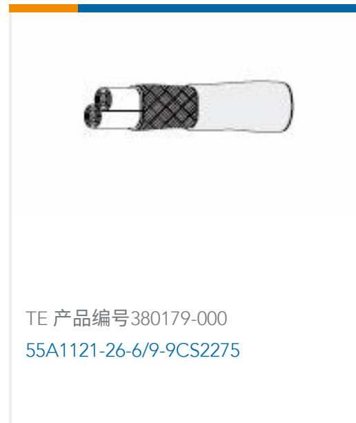
TE 产品编号380179-000 55A1121-26-6/9-9CS2275