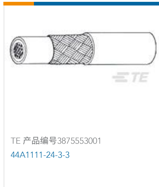
TE 产品编号3875553001 44A1111-24-3-3