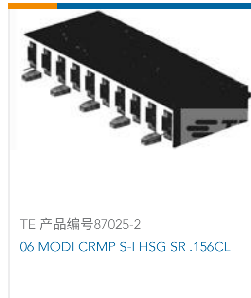
TE 产品编号87025-2 06 MODI CRMP S-I HSG SR .156CL