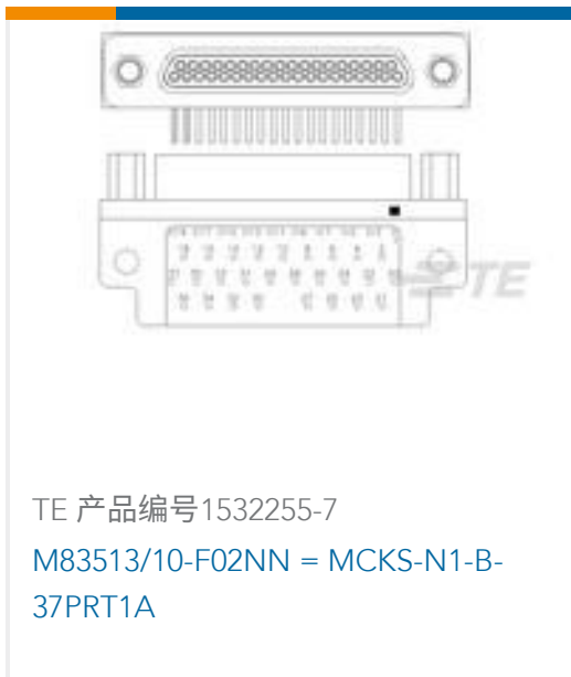
TE 产品编号1532255-7 M83513/10-F02NN = MCKS-N1-B-37PRT1A