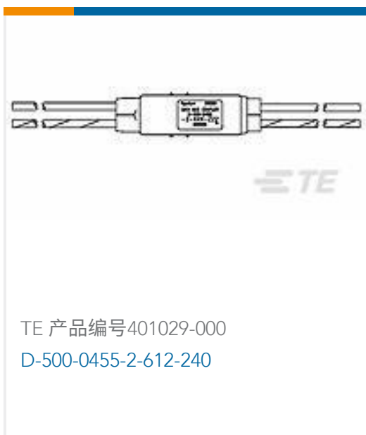
TE 产品编号401029-000 D-500-0455-2-612-240