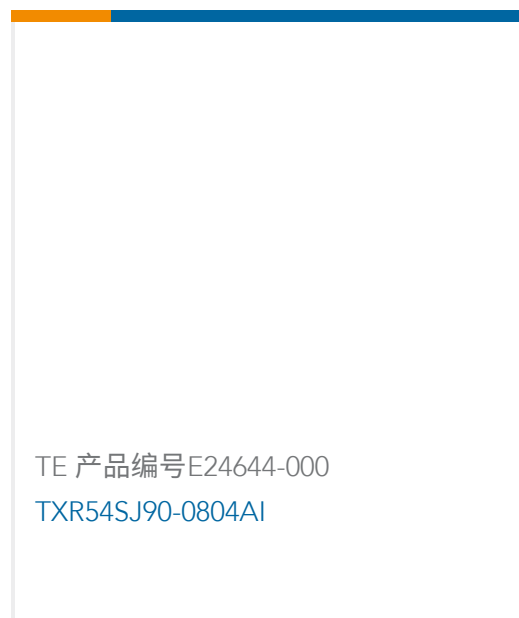
TE 产品编号E24644-000 TXR54SJ90-0804AI