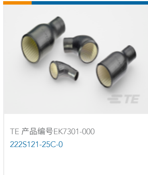
TE 产品编号EK7301-000 222S121-25C-0