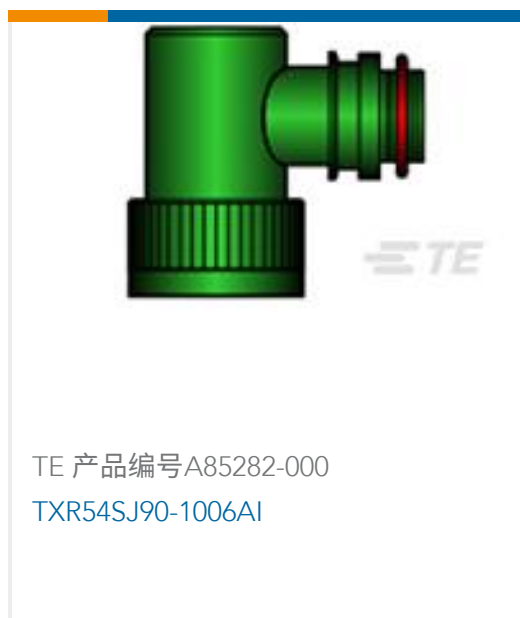
TE 产品编号A85282-000 TXR54SJ90-1006AI