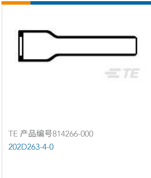
TE 产品编号814266-000 202D263-4-0