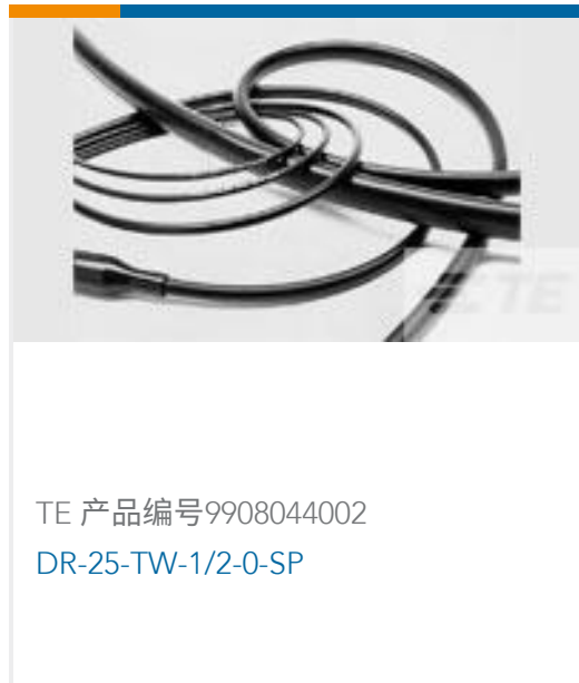
TE 产品编号9908044002 DR-25-TW-1/2-0-SP