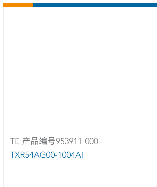
TE 产品编号953911-000 TXR54AG00-1004AI