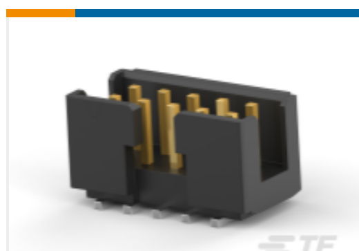
TE 产品编号1-2373376-0 10P,2MM,SHRD HDR,DRVT,SMD,0.1 AU,TB