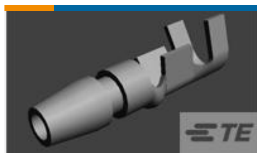
TE 产品编号170020-1 SHUR PLUG 20-14 MM2 TPBR