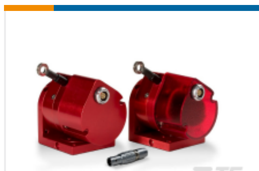
TE 产品编号04-1208-0082 MT2A-30E-14-10K-C1