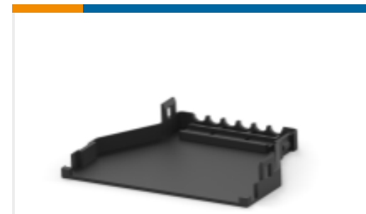
TE 产品编号1776695-1 Strain Relief, D5200, Dynamic