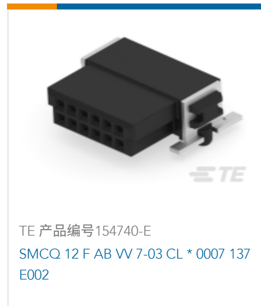
TE 产品编号154740-E SMCQ 12 F AB VV 7-03 CL * 0007 137 E002