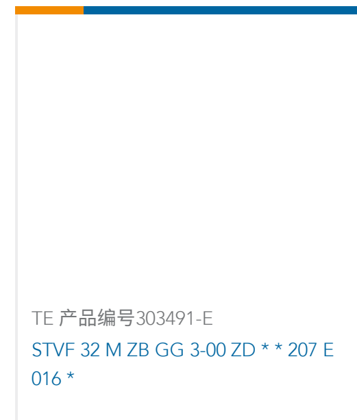
TE 产品编号303491-E STVF 32 M ZB GG 3-00 ZD * * 207 E 016 *