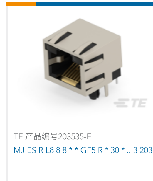
TE 产品编号203535-E MJ ES R L8 8 8 * * GF5 R * 30 * J 3 2035