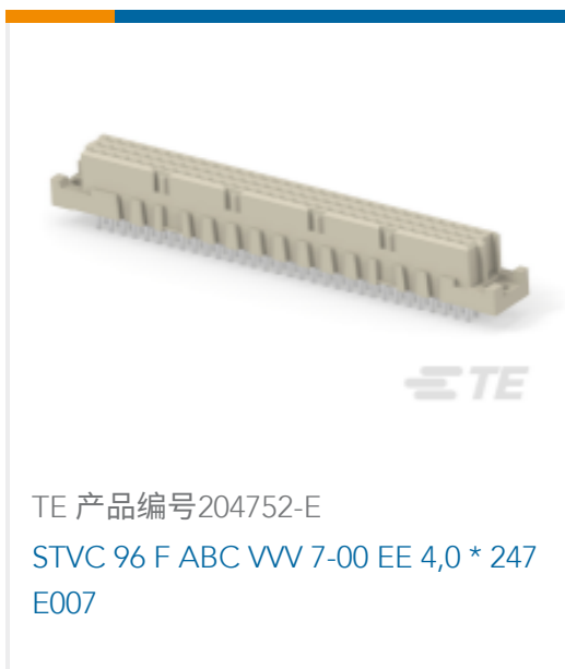
TE 产品编号204752-E STVC 96 F ABC VV 7-00 EE 4,0 * 247 E007