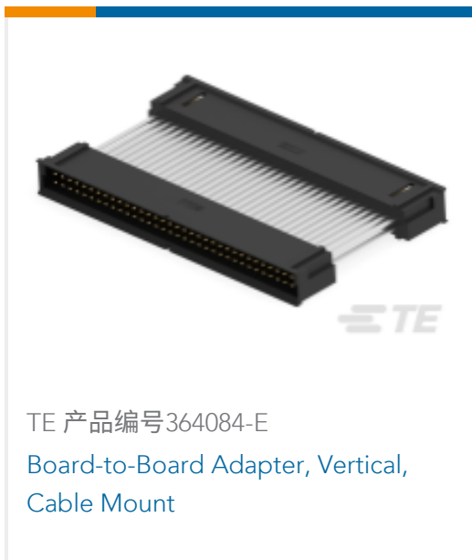
TE 产品编号364084-E Board-to-Board Adapter, Vertical, Cable Mount