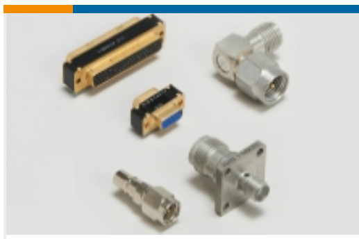
连接器适配器和连接器保护件(45)