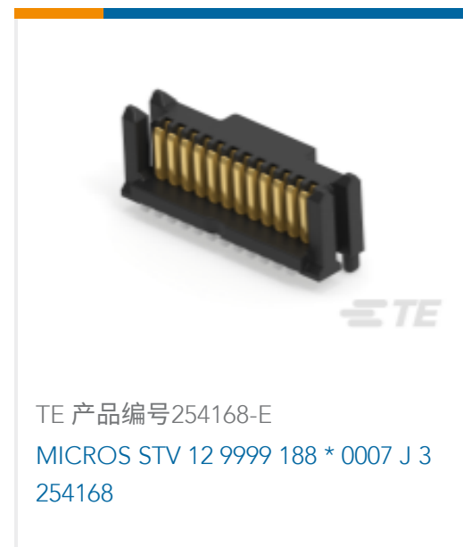
TE 产品编号254168-E MICROS STV 12 9999 188 * 0007 J 3 254168