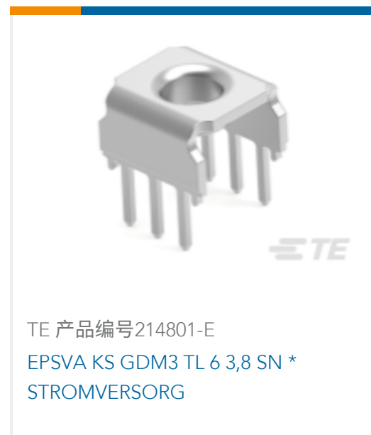
TE 产品编号214801-E EPSVA KS GDM3 TL 6 3,8 SN * STROMVERSORG