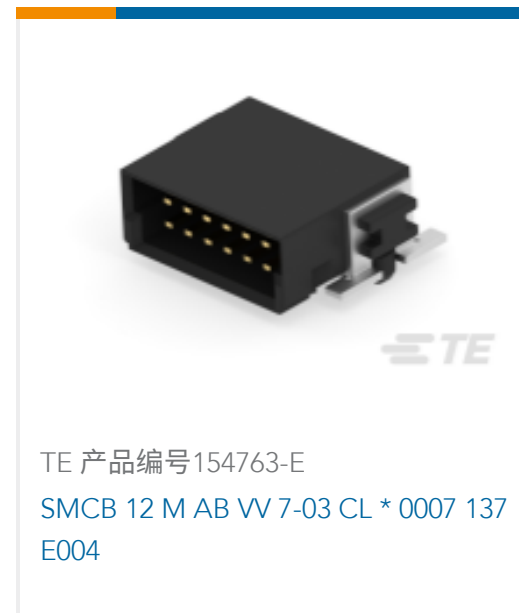
TE 产品编号154763-E SMCB 12 M AB VV 7-03 CL * 0007 137 E004