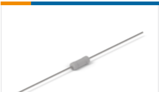
TE 产品编号7-1676123-7 1/2W SM M/OX 5% 1K2