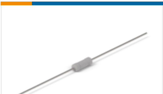
TE 产品编号7-1676123-9 1/2W SM M/OX 5% 1K5