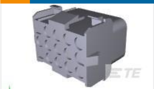
TE 产品编号926647-2 15P UN-MNL AUFN-GEH