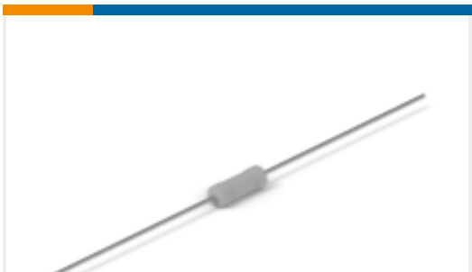
TE 产品编号6-1676123-0 1/2W SM M/OX 5% 240R