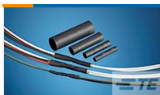
TE 产品编号2525596002 RBK-ILS-125-NR1-0-50MM