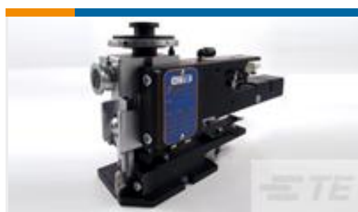
TE 产品编号2150034-2 OCEAN_2.0_APPLICATOR-E-110F180F-REA