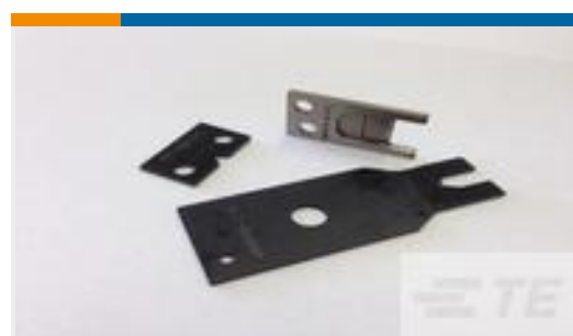
TE 产品编号2217206-4 Blade, Slug