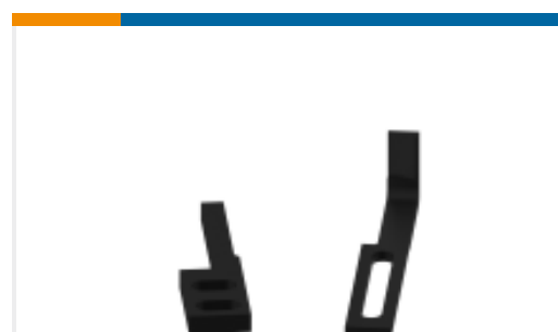
TE 产品编号240639-1 STRIPPER *1