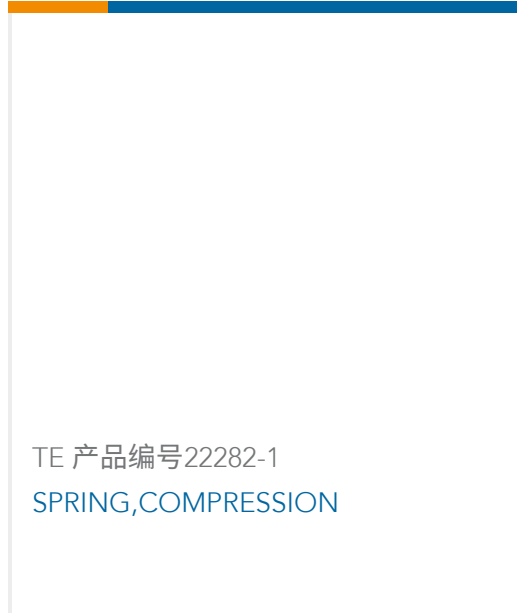
TE 产品编号22282-1 SPRING, COMPRESSION