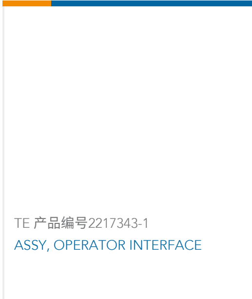
TE 产品编号2217343-1 ASSY, OPERATOR INTERFACE