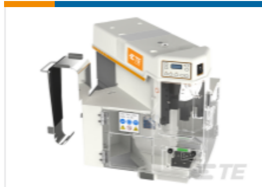
TE 产品编号2217002-2 G II CE THRU-SPLICE TERMINATOR, W/CQM