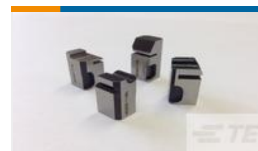
TE 产品编号1-690463-6 FLOATING SHEAR, REAR