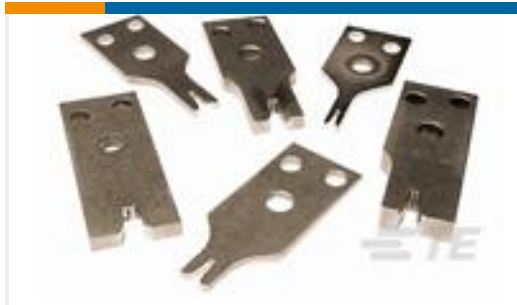
TE 产品编号1338211-4 CRIMPER, INSULATION, MODIFIED