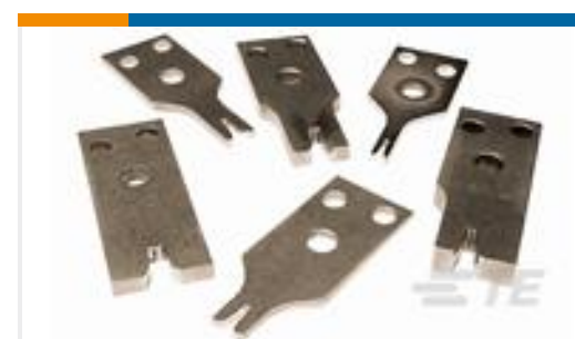
TE 产品编号1-1338223-4 Crimper, Thru Splice