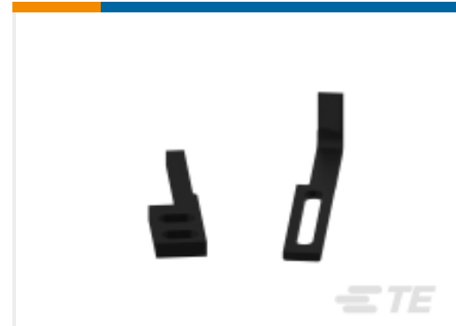
TE 产品编号1-690472-8 STRIPPER