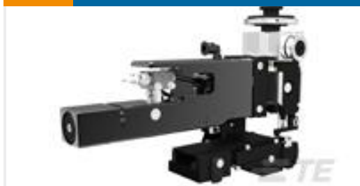
TE 产品编号2151025-2 OCEAN_2.0_APPLICATOR-S-090F200F