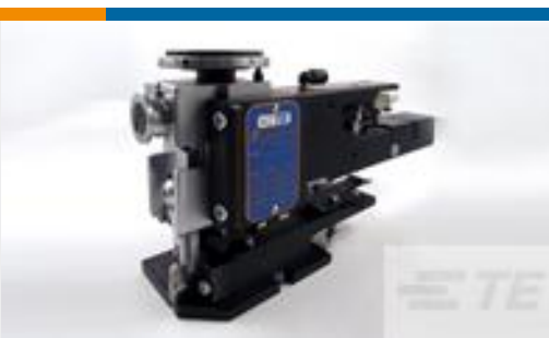
TE 产品编号2-2150198-2 OCEAN_2.0_APPLICATOR-E-210F250O