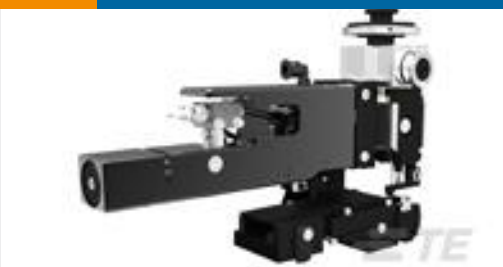
TE 产品编号2151772-2 OCEAN_2.0_APPLICATOR-S-070F102F