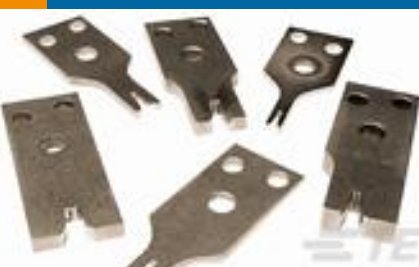
TE 产品编号453838-1 CRIMPER, WIRE-VAR WIDTH-F