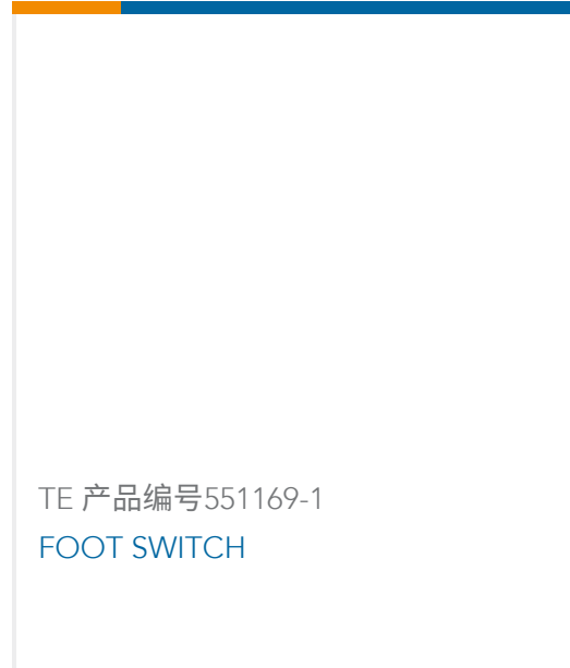
TE 产品编号551169-1 FOOT SWITCH