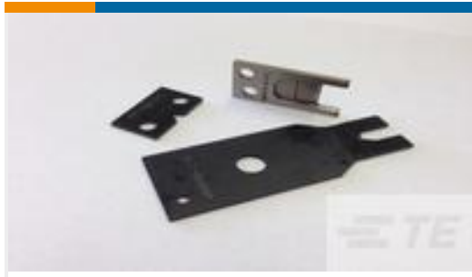
TE 产品编号8-240651-9 BLADE, SLUG