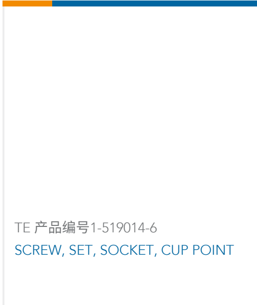
TE 产品编号1-519014-6 SCREW, SET, SOCKET, CUP POINT