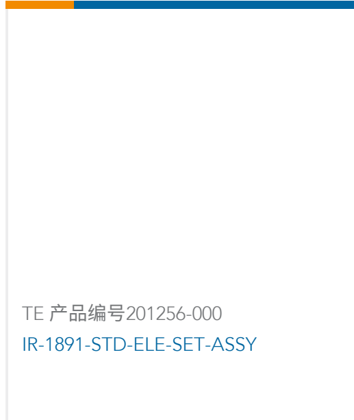
TE 产品编号201256-000 IR-1891-STD-ELE-SET-ASSY