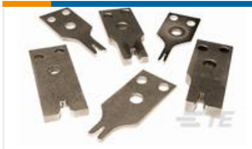
TE 产品编号8-458141-0 CRIMPER, WIRE (.160" 'F')