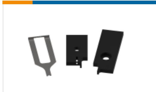
TE 产品编号2119791-5 Depressor, Wire