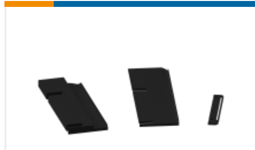
TE 产品编号1320928-2 STRIP GUIDE