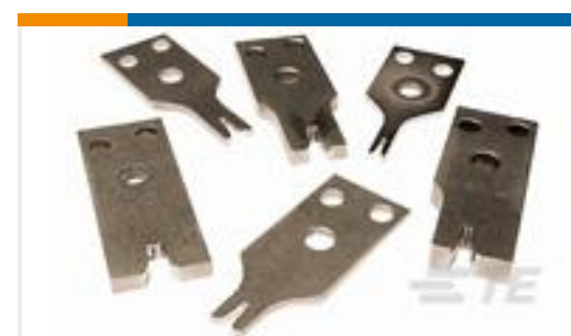
TE 产品编号2-456408-9 CRIMPER WIRE .110 "F"