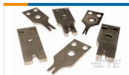
TE 产品编号1633965-8 CRIMPER, INSUL O PREMIUM