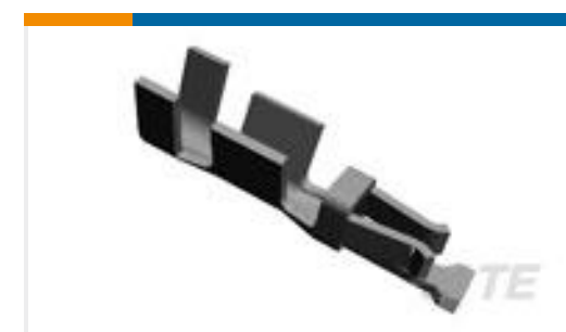
TE 产品编号969047-3 MODU CRIMP CONTACT