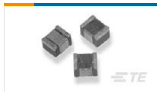
TE 产品编号1879023-6 3650 1008 22nH 5% 2K RL