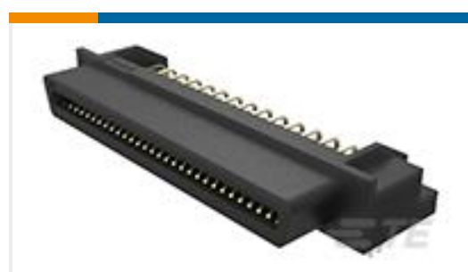
TE 产品编号5175474-6 CHAMP 050 B/B REC H W/LEG 50P