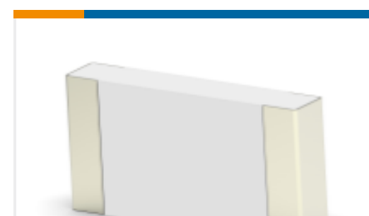
TE 产品编号5-2176245-5 CRGS1206 5% 33K