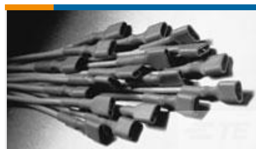
TE 产品编号2859674001 LSTT-9.5-2-SP