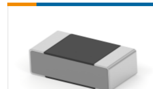
TE 产品编号7-1879417-3 CPF0603 681K 0.1% 25PPM 1K RL