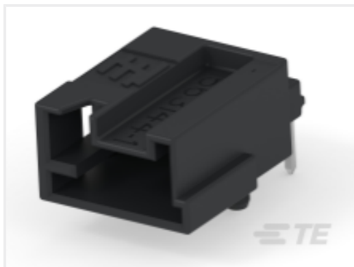
TE 产品编号1563144-1 3POS,TAB 0.63X0.64,HEADER ASSY,BK