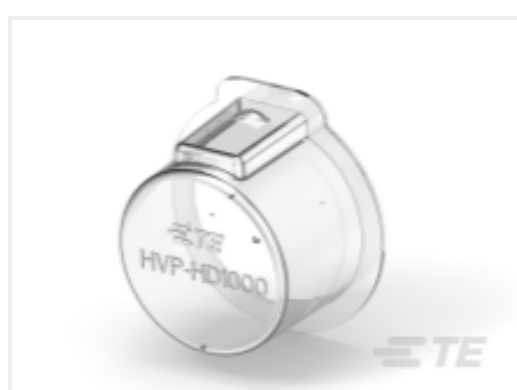
TE 产品编号2407806-1 COVER,SHIPPING CAP FOR HD1000 HEADER