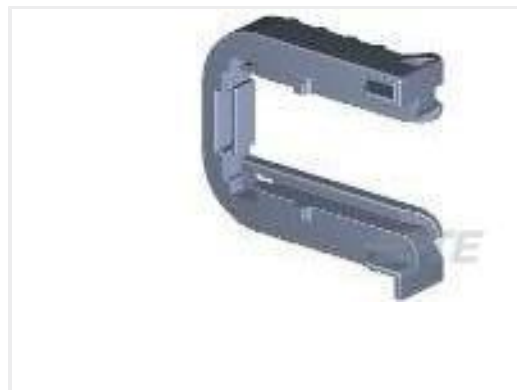
TE 产品编号1564562-1 SLIDE,TAB HSG GROUP D