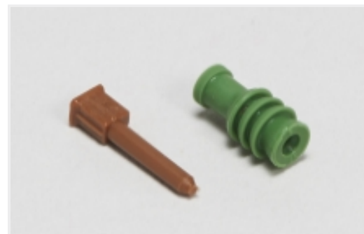
汽车密封件和盲堵(7)