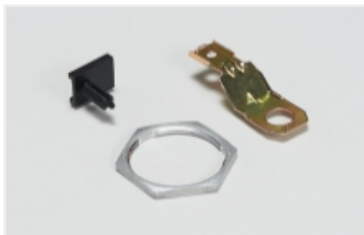
其他汽车连接器附件(18)