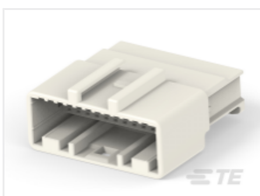
TE 产品编号2403200-1 24POS,0.64X0.64,TAB HSG ASSY, UNSLD