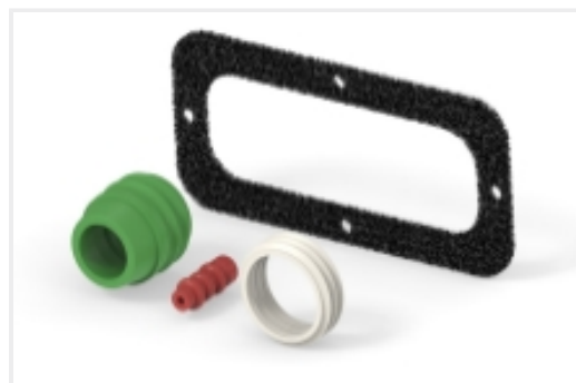
连接器密封件和盲堵(7)