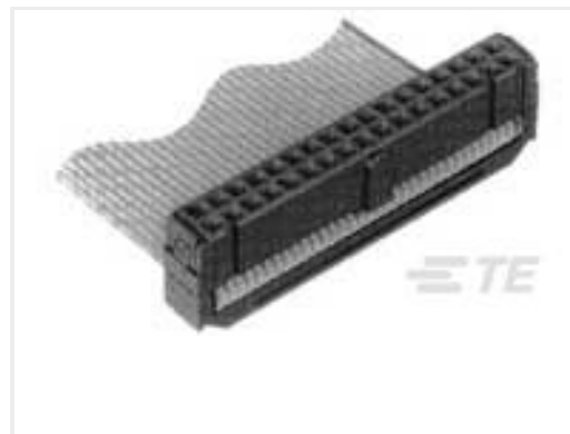
TE 产品编号1-1658622-0 50 NOVO MIL/CTR 30DP,LEAD FREE