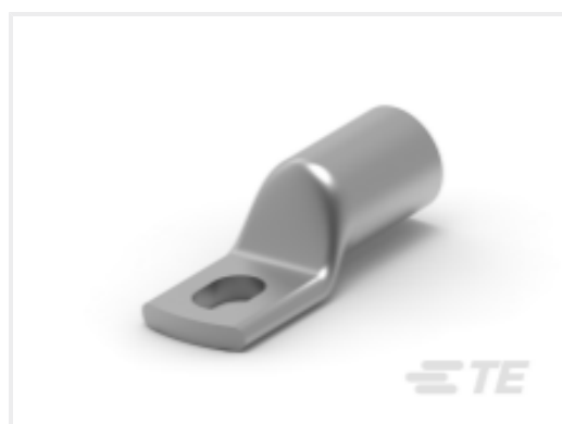
TE 产品编号2365737-1 RING TONGUE TRMNL,70MM2 WIRE FOR IPT