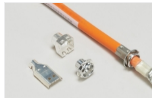
汽车连接器 EMC 屏蔽(11)