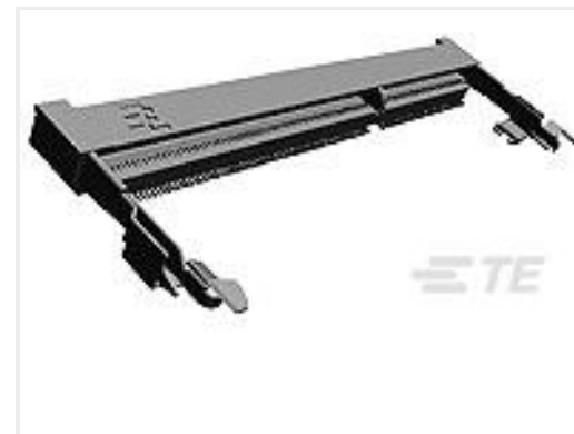
TE 产品编号2013289-1 SEMI-HARD TRAY DDR3 204P 5.2H STD