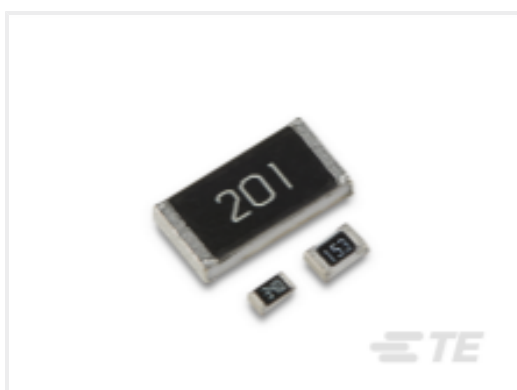
TE 产品编号2176326-1 CRGP 0603 10R 1%