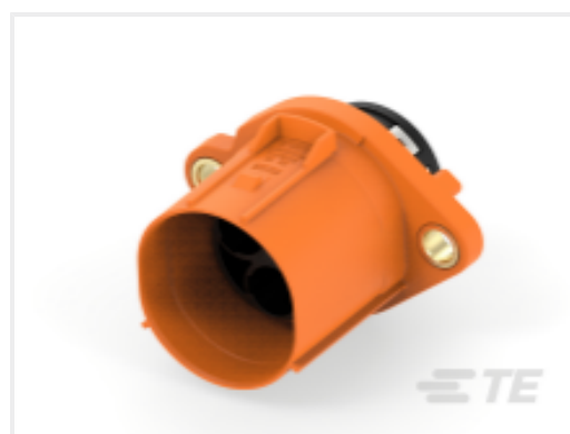
TE 产品编号2371113-1 3POS,DIA 4MM,PIN HSG ASSY,SLD, COD A