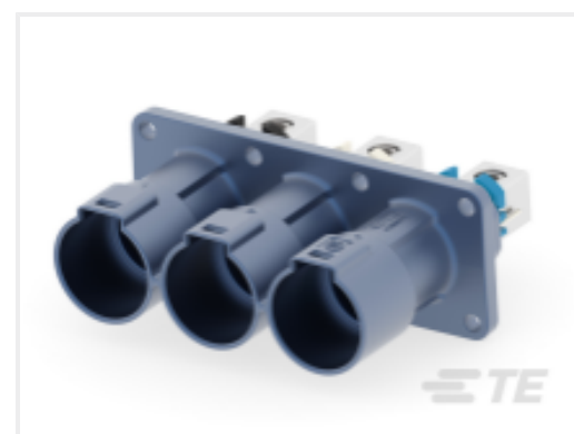
TE 产品编号1-2394062-1 3POS,HVP1000,ASSY,180DEG,COD A /B/C