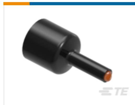
TE 产品编号 CAT-HST-QS1500 QS1500 热缩管