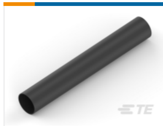
TE 产品编号 CAT-HST-CGPE CGPE 热缩管