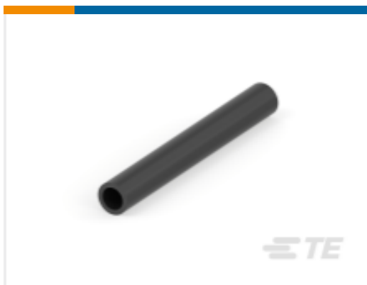
TE 产品编号 CAT-HST-RBKILS RBK-ILS 热缩管