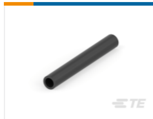
TE 产品编号 CAT-HST-RT3 RT-3 热缩管