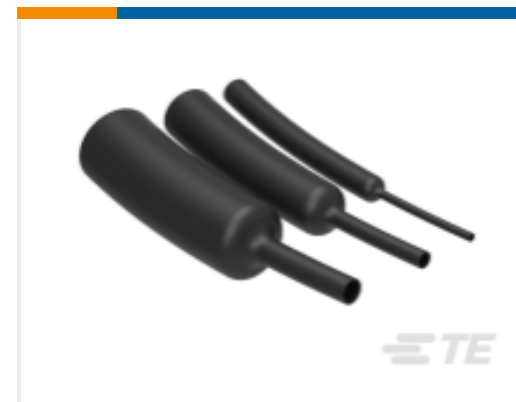
TE 产品编号 5677576049 RNF-3000-6/2-0-40MM