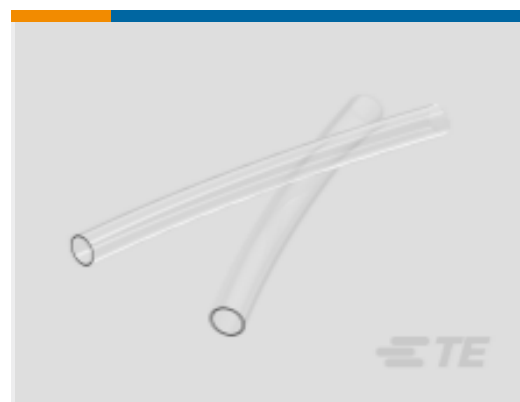
TE 产品编号 CAT-HST-ES1000 ES1000 热缩管