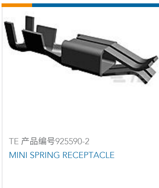
TE 产品编号925590-2 MINI SPRING RECEPTACLE