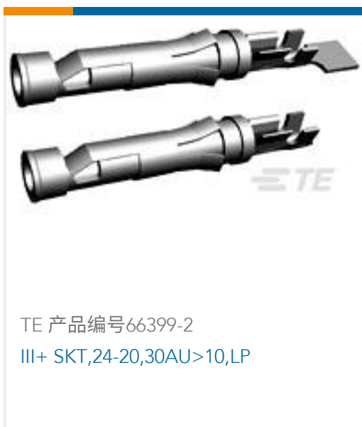
TE 产品编号66399-2 III+ SKT,24-20,30AU>10,LP