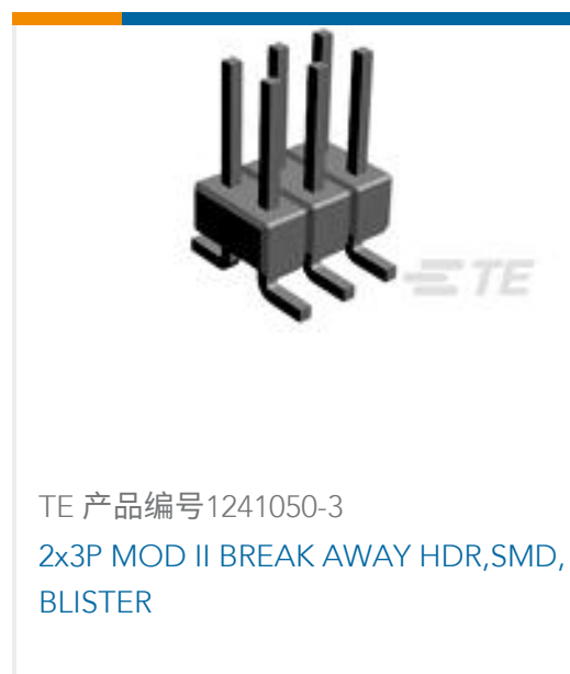
TE 产品编号1241050-3 2x3P MOD II BREAK AWAY HDR,SMD, BLISTER