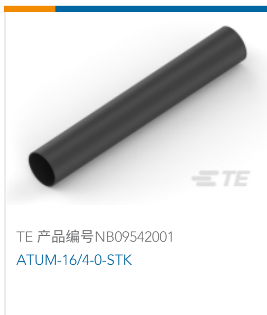
TE 产品编号NB09542001 ATUM-16/4-0-STK