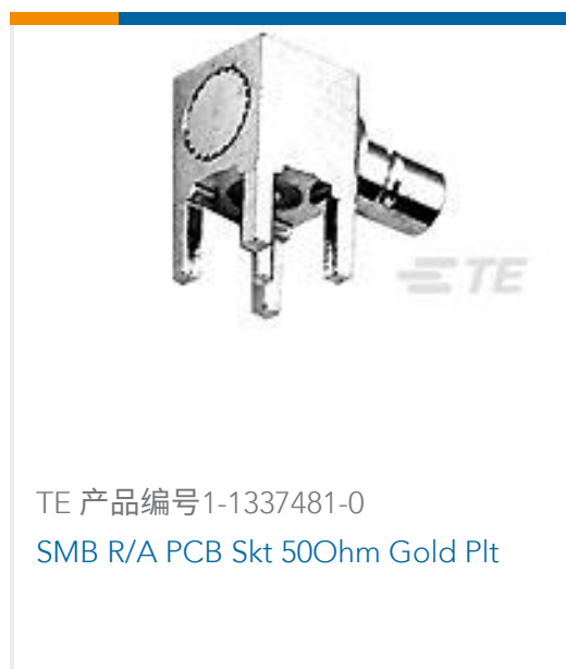
TE 产品编号1-1337481-0 SMB R/A PCB Skt 50Ohm Gold Plt