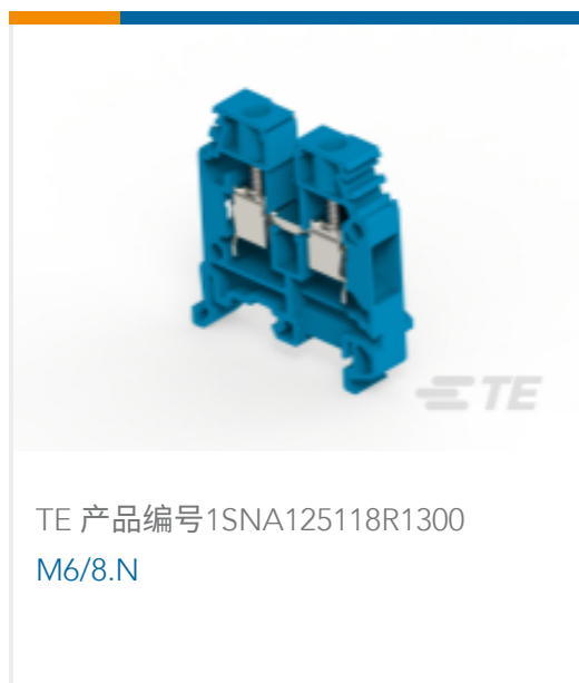
TE 产品编号1SNA125118R1300 M6/8.N