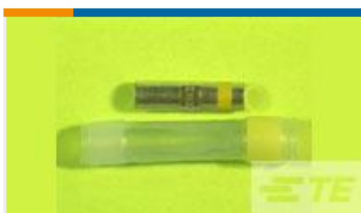
TE 产品编号650098-000 D-436-75