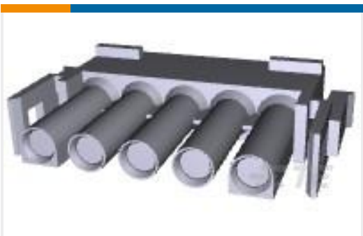
TE 产品编号926299-3 5P UN-MNL STECKGEH