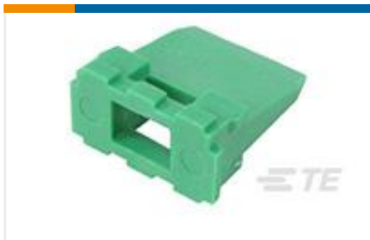
TE 产品编号W6P WEDGE LOCK, 6P, REC, GRN, DT