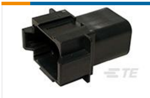
TE 产品编号DT04-08PB REC, 8P, BLK, N, B