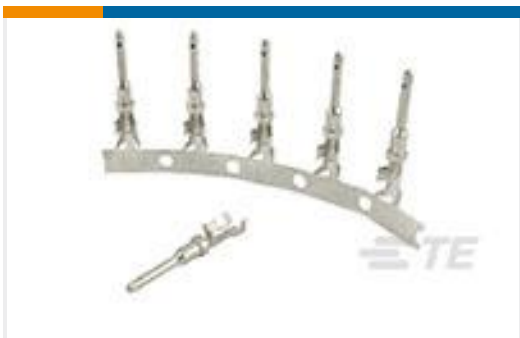
TE 产品编号1060-16-0122 PIN, SF, SIZE 16, 14-18, NI/SN