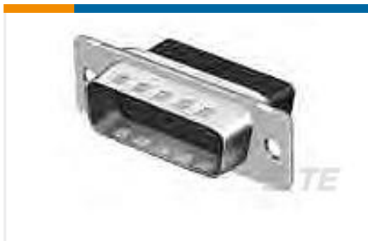
TE 产品编号167293-1 15P.HDP20 PLUG ASSY