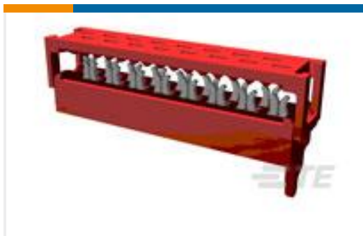
TE 产品编号215083-6 MICRO-MATCH MOW.06P