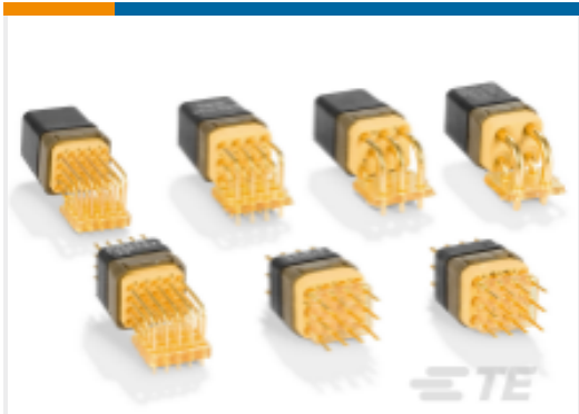
TE 产品编号 ZPF000000000110282 732-8255-16