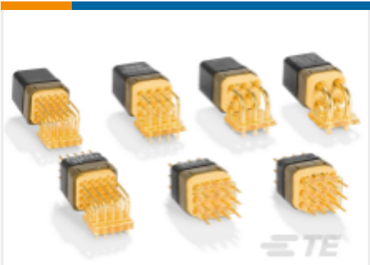
TE 产品编号 ZPF000000000100306 732-8256-22