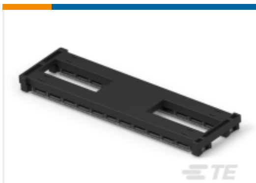
TE 产品编号 2369315-1 16G 05FH 4H rec aassy 440POS 8u" Au