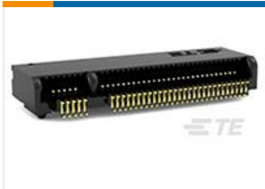
TE 产品编号 2199119-8 M.2 0.5PITCH 3.2H KEY A 15U" AU