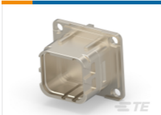
TE 产品编号 ZPF000000000100795 Rectangular Connector Receptacles, Tool-less Assembly