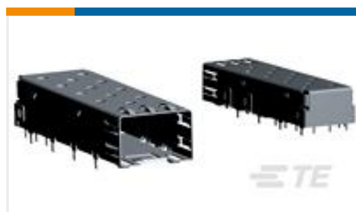
TE 产品编号2227303-1 CAGE ASSEMBLY, SFP, .140 SOLDE