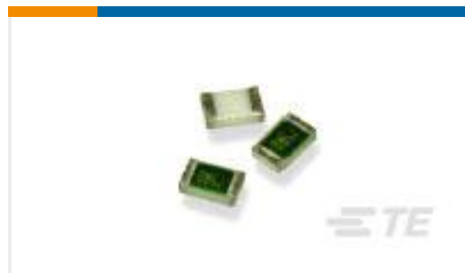
TE 产品编号9-1879215-1 CPF 0402 40K2 0.1% 25PPM 1K RL