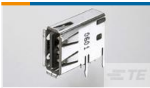
TE 产品编号292336-1 Std USB Type A, Flag, T/H