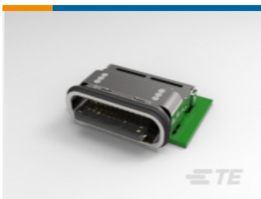
TE 产品编号 2305018-2 USB TYPE C, REC IPX8 ON BOARD DUAL SMT