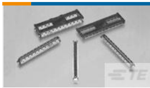
TE 产品编号3-6318490-6 .5FHR04H,220,S,GIG,08/Sn,HT,NSYes