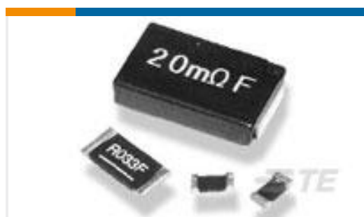
TE 产品编号2176117-3 TLR 1206 1.0W R001 1% 50PPM 2K RL