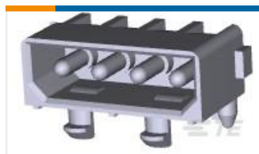
TE 产品编号641737-1 04P CMNL HDR ASSY R/A PC NATL