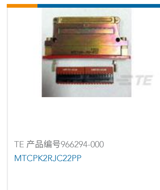
TE 产品编号966294-000 MTCPK2RJC22PP