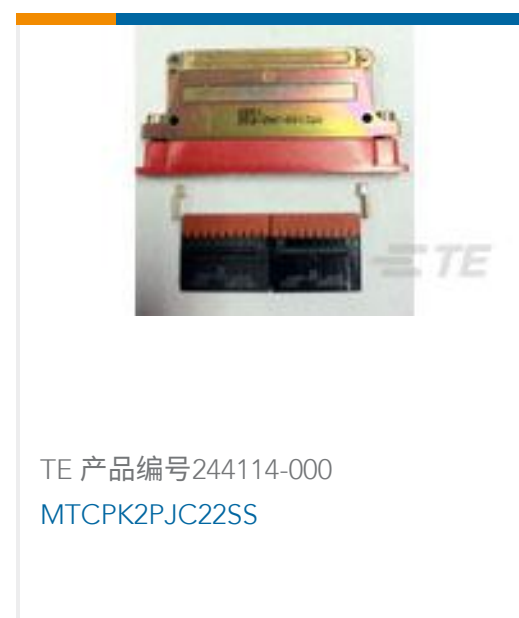
TE 产品编号244114-000 MTCPK2PJC22SS