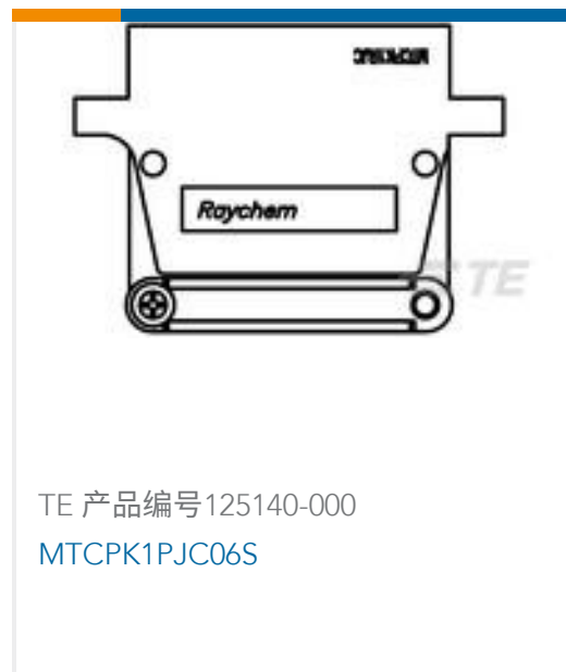
TE 产品编号 125140-000 MTCPK1PJC06S