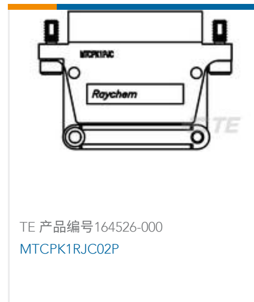
TE 产品编号164526-000 MTCPK1RJC02P