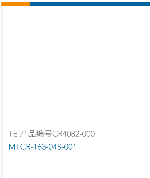
TE 产品编号CR4082-000 MTCR-163-04S-001