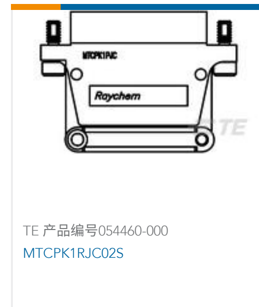
TE 产品编号054460-000 MTCPK1RJC02S