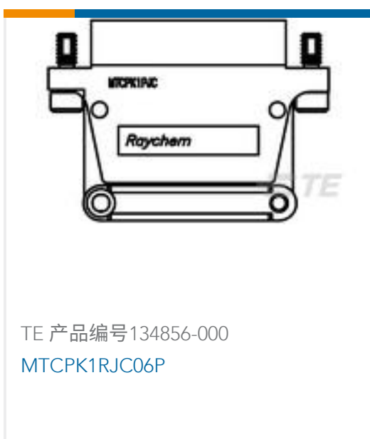
TE 产品编号134856-000 MTCPK1RJC06P