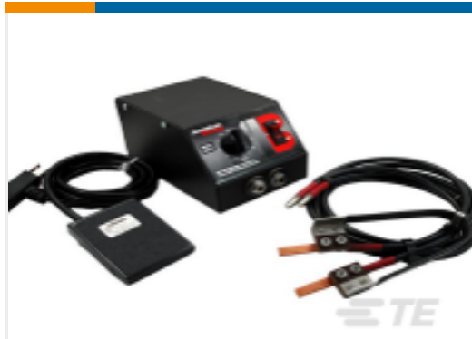
TE 产品编号 173643-000 RH-3960-1-TINEL-KIT-120V