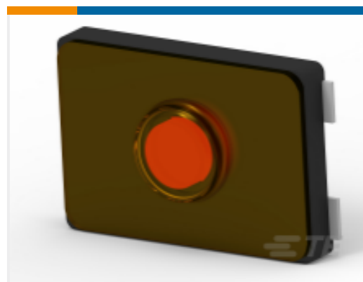
TE 产品编号 2337225-1 TACT ULTRA TB 2.8X1.9X0.6 160GF