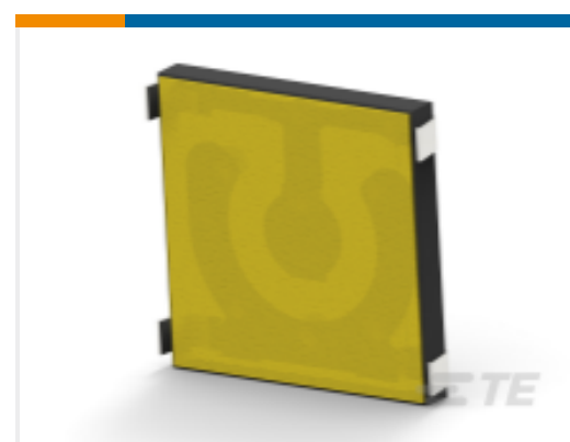
TE 产品编号 2337234-2 TACT MICRO JB 4.6X4.4X0.55 P3.5 160GF