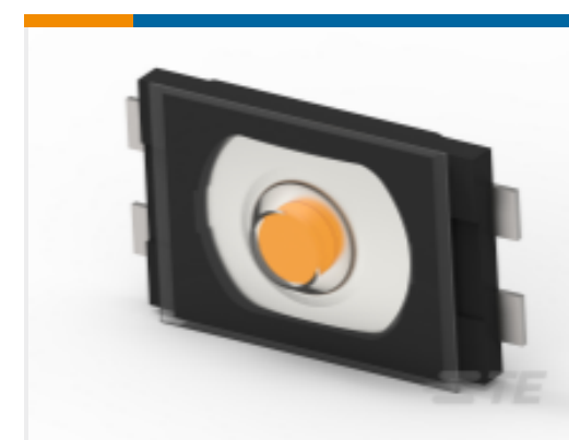
TE 产品编号 2337224-1 TACT ULTRA TB 2.6X1.6X0.55 160GF