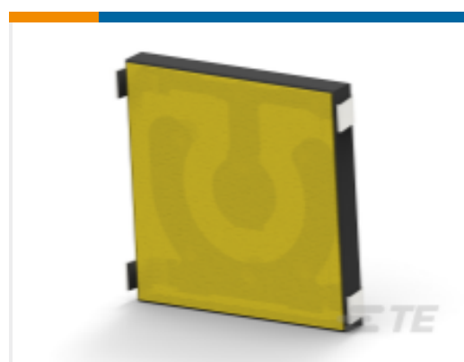
TE 产品编号 2337234-1 TACT MICRO JB 4.6X4.4X0.55 P3.5 100GF