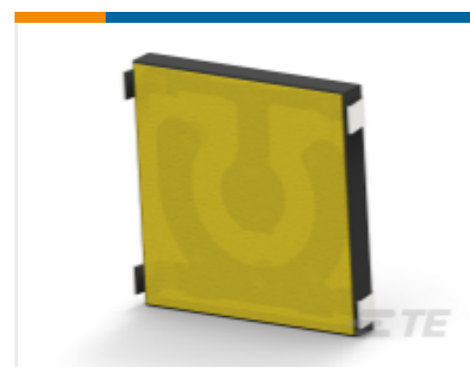
TE 产品编号 2337234-3 TACT MICRO JB 4.6X4.4X0.55 P3.5 200GF