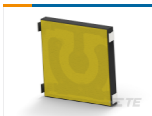
TE 产品编号 2337234-1 TACT MICRO JB 4.6X4.4X0.55 P3.5 100GF