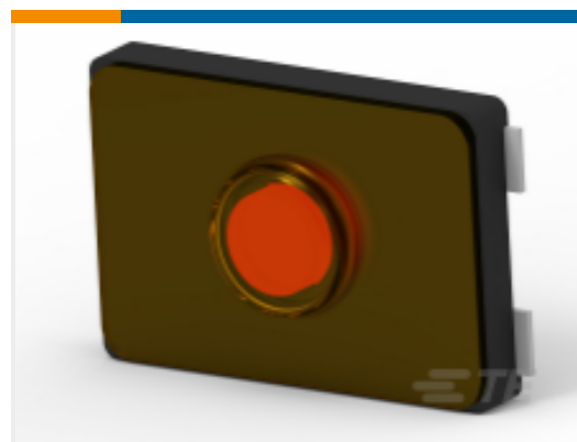
TE 产品编号 2337225-1 TACT ULTRA TB 2.8X1.9X0.6 160GF