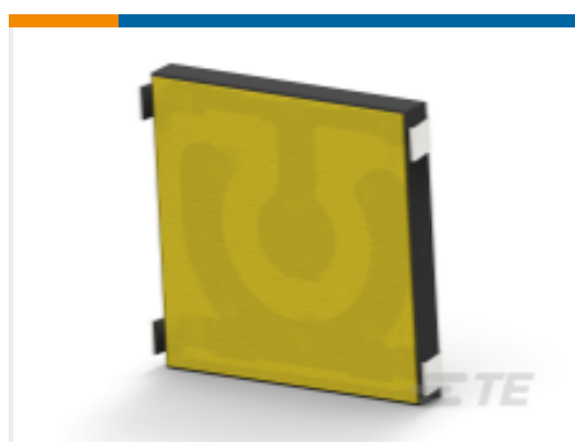
TE 产品编号 2337234-2 TACT MICRO JB 4.6X4.4X0.55 P3.5 160GF