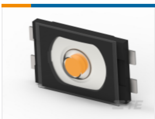
TE 产品编号 2337224-1 TACT ULTRA TB 2.6X1.6X0.55 160GF