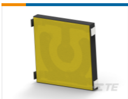
TE 产品编号 2337234-3 TACT MICRO JB 4.6X4.4X0.55 P3.5 200GF