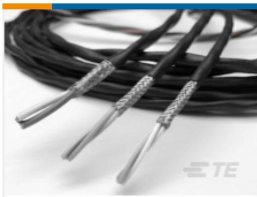
TE 产品编号 CAT-R2137-Z612E RL1121 双芯电缆