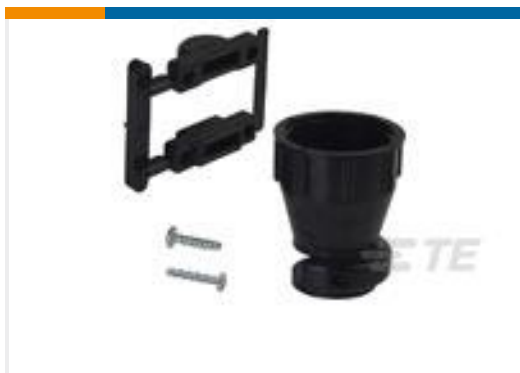
TE 产品编号206070-8 CABLE CLAMP KIT #17