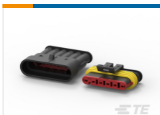
TE 产品编号282104-1 AMP SUPERSEAL 1.5MM, 连接器壳体