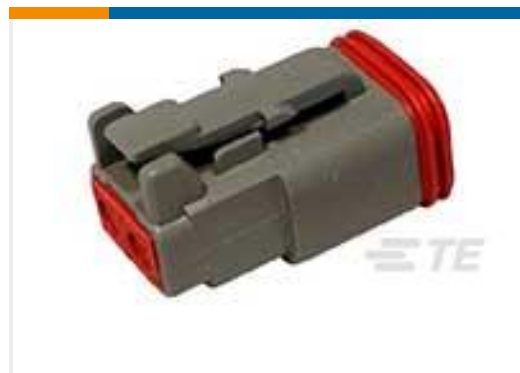
TE 产品编号DT06-2S PLG, 2P, GRY, N