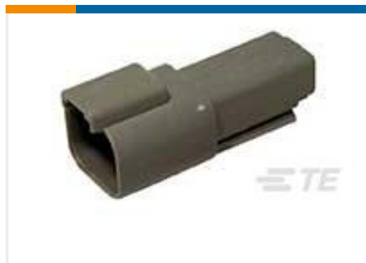
TE 产品编号DT04-2P REC, 2P, GRY, N