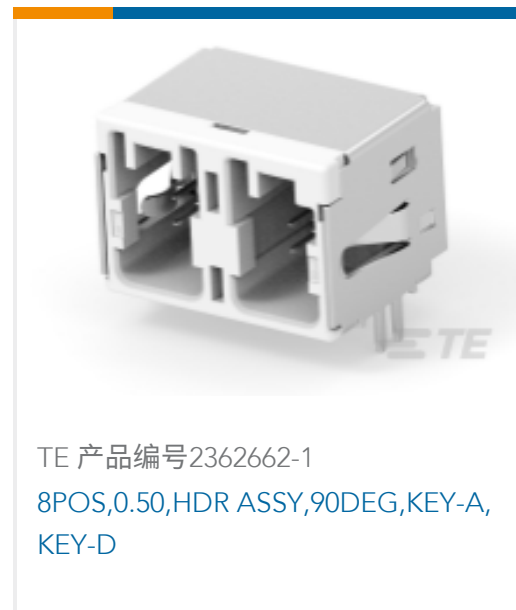
TE 产品编号2362662-1 8POS,0.50,HDR ASSY,90DEG,KEY-A, KEY-D