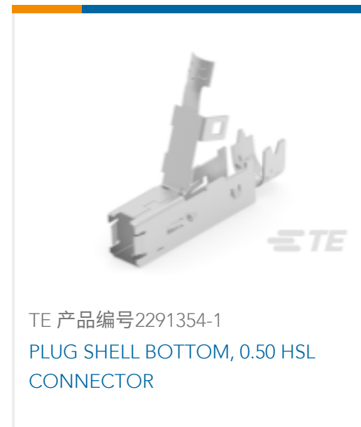
TE 产品编号2291354-1 PLUG SHELL BOTTOM, 0.50 HSL CONNECTOR