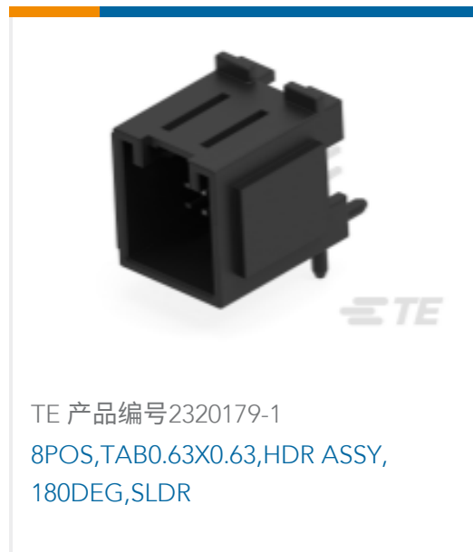
TE 产品编号2320179-1 8POS,TAB0.63X0.63,HDR ASSY, 180DEG,SLDR