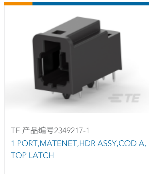
TE 产品编号2349217-1 1 PORT,MATENET,HDR ASSY,COD A, TOP LATCH